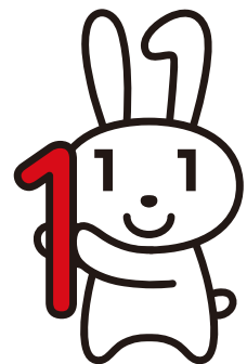
マイナンバー 広報キャラクター マイナちゃん

住民票を有する全ての人に一人一つの番号、すなわちマイナンバー(個人番号)を付して社会保障、税、災害対策の分野で効率的に情報を管理し、複数の機関に存在する特定の個人の情報が同一人の情報であることを確認するために活用されるものです。